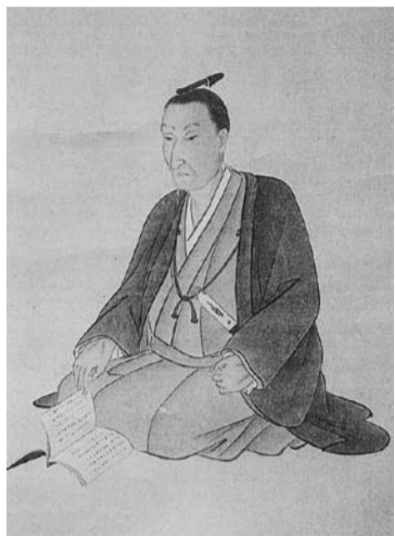
吉田松陰像(松浦松洞画)

めた教育者としての松陰にスポットライトを当てたいと思います。身分的人間的なあらゆる差別を憎み、悩み苦しむ人々に手を差し伸べ、なんとか自立できるように力を尽くした一人の純真な若者の姿を追