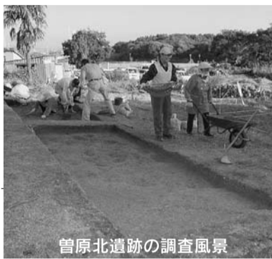
曾原北遺跡の調査風景