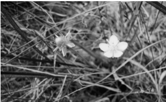
枯れ草の中に咲くウメバチソウ