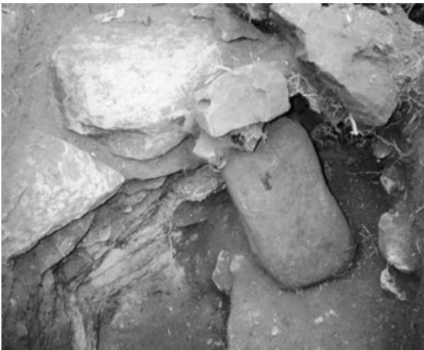
中連古墳の石室の石

先号で紹介した機関紙「むつみ」では、中連古墳にまつわる恐怖伝説を記載しています。要約して引用をします。