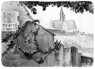
モンレゾースケッチ

古城には今も城主の家族が住んでおられ、私たちが絵を描いていると譲ってくれと言われました。丁寧に断ると今度はプライベートなコレクションを是非見せたいと私邸に招き入れてくださいました。