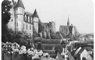
F100号 montresor スケッチを元に描いた油絵「幻想X」