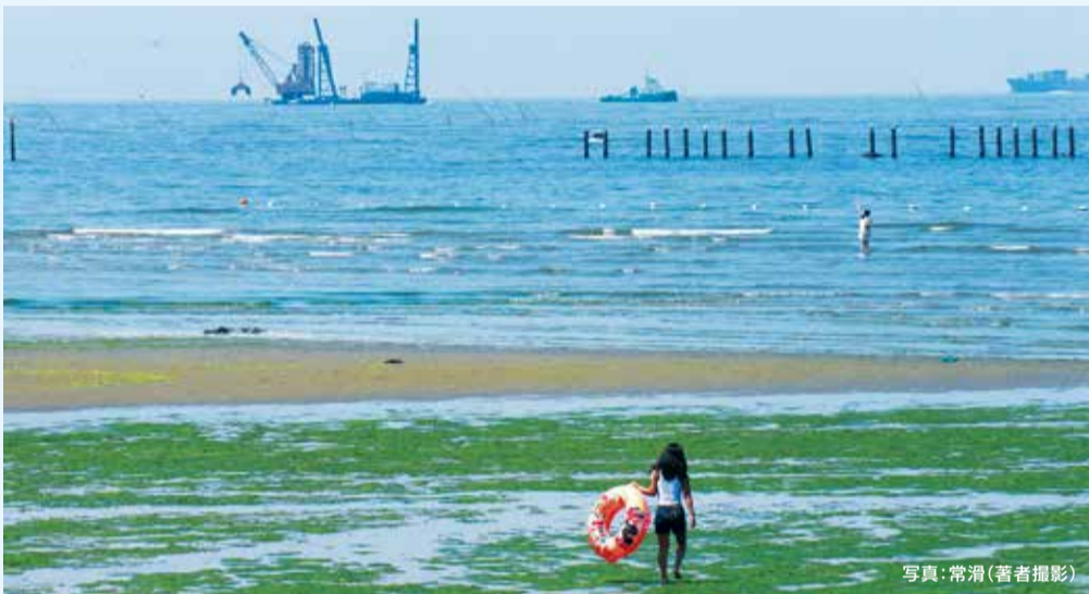
写真:常滑(著者撮影)

いまならインターネットが普及しているので通信手段は格段に向上している。当時でも先進国からだとFAX