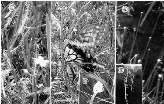
暑さ紛らす吉野田湿原の植物群

TVも毎日のように、暑さを報じていた。「地球規模の平均気温は、過去二三年で地球が最も暑い年に」