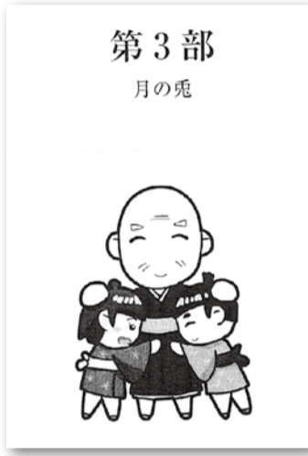
さし絵(杉本莊一画)

くと、年老いた私でさえも、着物の袖がぐつしよりと濡れてしまふほど涙が止まらなくなります。