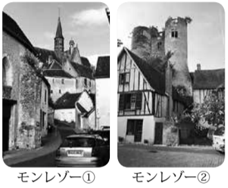
モンレゾー① モンレゾー②

一番高い場所まで登りそこから螺旋状に降りてくるのが効率的。写真を撮られる方はお分かりだと思いますが構図というのは半歩違って見える景色が違います。