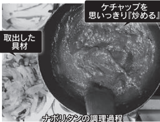
ケチャップを思いっきり「炒める」 ナポリタンの調理過程 取出した具材

風葉の作品を庶民視線で改めて読んで欲しいと思います。そして評価も変えて欲しいと思います。