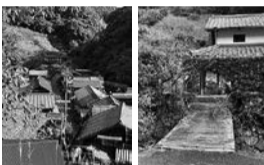
宇津ノ谷の集落 花沢の里①

その④ 負いがない。これは最近思うようになりました。一人だから自由だから、時間の制約がない分自分に厳しく、ノルマをもって計画を立てた旅行をしていましたが、長距離の高速、狭い道もくねくね道もあります。雨や風もカンカン照りもあります。下調べはしているもの、行き当たりばったり、臨機応変に対処することが大事だと気がきました。雨の日には美術館巡りをするといった具合に変更するのもありです。