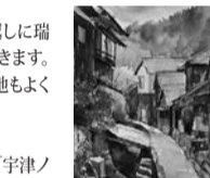
花沢の里スケッチ

10月末、富士の見える海岸沿いで描いていると水を忘れたことに気がきました。周りは海水しかありません。20mくらい離れたところに釣り人がいたので、水持ってらっしゃいますか？とお尋ねすると快く分けてくれました(釣り人は手を洗ったりするのに絶対真水を持っています。釣った魚も見せてくれました)。この時期に富士がきれいに見えることはまれだそうで、後日友人にラッキーだったといわれました。実際2泊3日の間、裾野まできれいに見られたのは初日だけでした。松原越しに瑞雲のように雲たなびく富士山を描いているとトンビがなき、タンカーが清水港に入っていきます。2枚描いて、初日は終了。ビジネスホテルは網元の経営するビジネスホテルで大変居心地もよく料理もマゴロがおいしかったです。