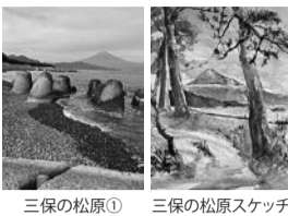
三保の松原① 三保の松原スケッチ

その① スケッチをして回る一人旅は車での移動に限定しました。スケッチは荷物が多いので。絵を立てかけるイーゼル、スケッチブック、椅子、ピクニックシート、寒さ対策のひざ掛け、簡易クッション、それに水彩画具一式、水、帽子、手袋など、虫よけと虫刺されの薬も欠かせません。リュックにひとまとめにしても相当な大きさになってしまいます。車でしたら後ろに入れておけば現地まで持っていけます。