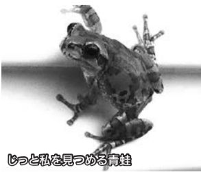
じつと私を見つめる青蛙

割と近くなのに今まで訪れていなかったこんな美しい場所が、まだまだたくさんあるのだろうか…。一人旅はまだまだ続きます。