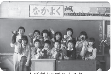
人形劇クラブの人たち

二時間目に入形げきクラブの人たちが人形げきをしてくれました。と中で氏原先生の声が出てきました。あとでたれかが「さっき先生の声が出てきたなあ」と言ったら、先生が「だれかが先生の声をまねしてやった」と言いました。