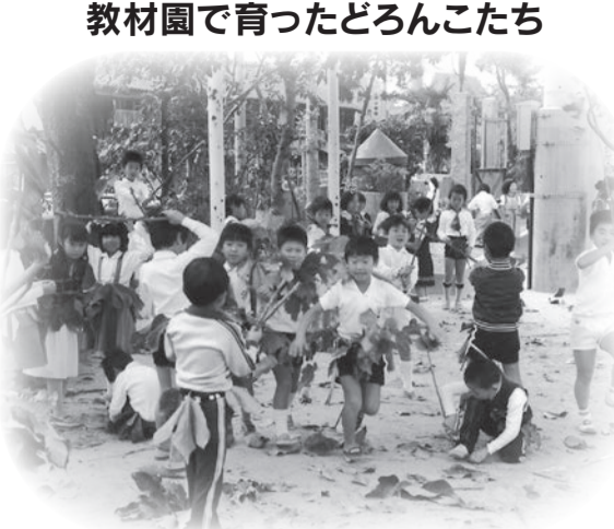
図工「はっぱでへんしん」