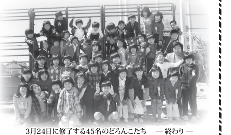
3月24日に修了する45名のどろんこたち — 終わり —

この指とまれ (336) 氏原朝信 昭和55年度常滑西小学校二年二組(ごらん) 半日入学の準備(2月16日(月))