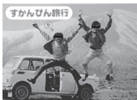
社内報に載ったもの。背景は浅間山。タイトルの命名は広報部

2日目は浅間山麓を抜け草津温泉湯畑へ。白根山湯釜内を散策。湖畔では大渋滞で動けず、雪を食べて水分補給。志賀高原の木戸池を回り、善光寺に着いたのもまた夜遅く、やはり駐車場で車中泊。