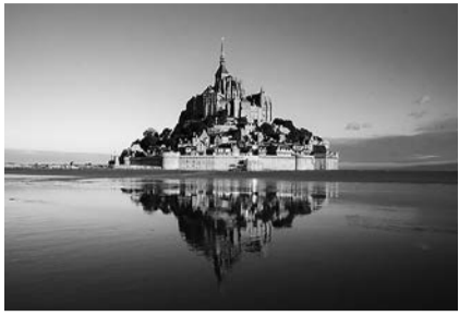
海に浮かぶ世界遺産の「モンサンミッシェルとその湾」(現地にポストカードより)

島のある湾は潮の干満の差が約15メートルもあり、ヨーロッパでも有数の激しい所として知られている。このため湾の南東部に位置する修道院が築かれた岩で出来た小島は、かつて満ち潮の時には海に浮かび、引き潮の時には自然に現れる砂洲で陸と繋がっていたのだ。