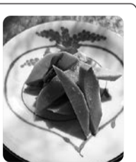
☆保存は、粗熱を取り清潔な袋に詰め、空気を抜いて冷凍すると、3ヵ月ほど美味しく食べることができます。

◎常滑市民文化会館 展示室 ▼常滑市文化協会 第42回評議員総会並びに表彰式・十三日(土) 午前10時~同十一時半 関係者 問合せ 常滑市文化協会事務局 35-12920 ▼常滑市文化協会・文化会館協働事業 文化ふれあい体験広場・二十七(土) 午後一時半~ 第一・二展示室 問合せ 常滑市文化協会事務局 35-12920