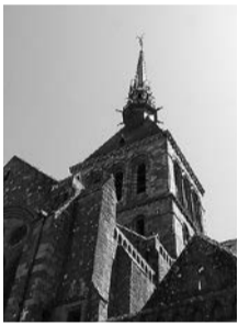
仰ぎ見る修道院の外観。尖塔にミカエル像

「海のピラミッド」を「島に戻すプロジェクト」モン・サン・ミッシェルの歴史は、708年に司教オベールが夢のなかで「大天使ミカエルからこの岩山に聖堂を建てよ」とのお告げを受け、ここに礼拝堂を作つたのが始まりとのこと。