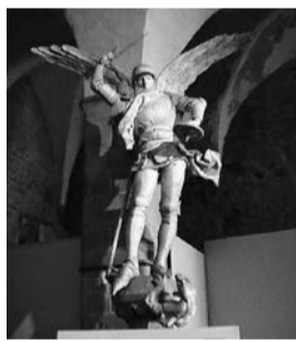
修道院内にあるミカエル像

礼拝堂を出た所に巨大な車輪があつた。ガイドによると、修道院の一部が牢獄として使われていた時代に囚人用の食料として使われていたために作られたとのことだ。このほか修道士たちが写本などを作った作業室や遊歩場、騎士の間など多くの部屋があり、あつたという間に2時間が過ぎていた。修道院を出て、入り口にジャンヌ・ダルクの像があるサンピエール教会もぞいでみてみた。小さな教会だけども内部の祭壇も整えられ、落ち着いた雰囲気だ。